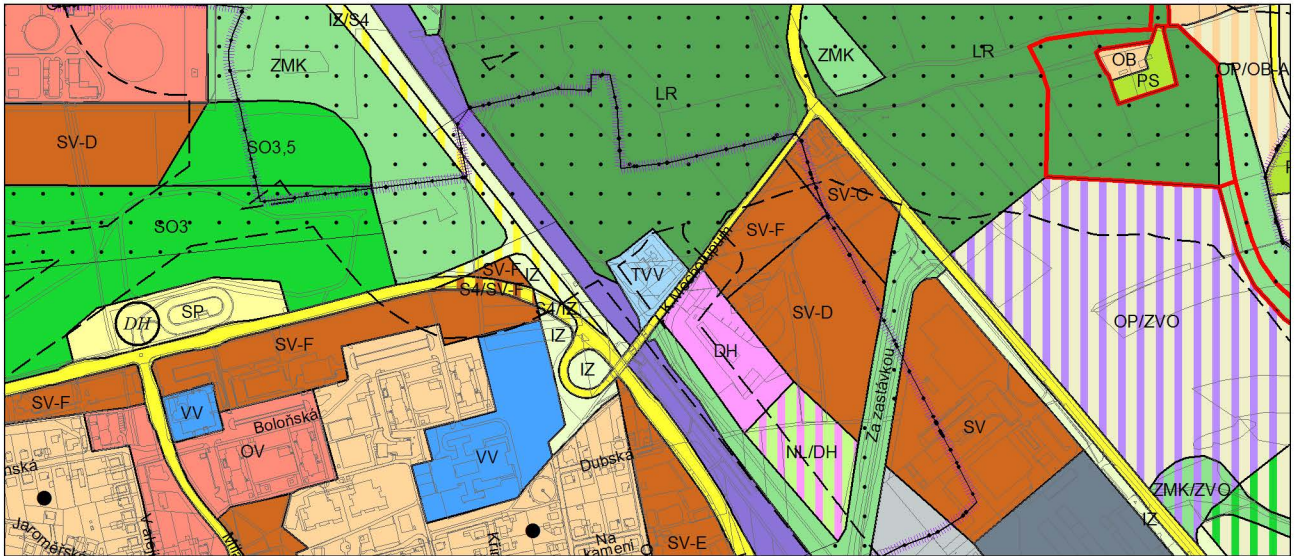
Výkres č. 4 – Plán využití ploch, platný stav k 1. 1. 2017